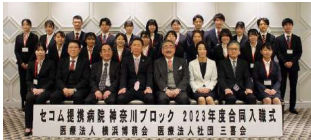
リハビリテーション部 19名 / 薬剤科3名