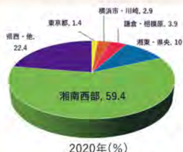
2020年に回復期リハビリテーション病棟に入院した患者さんの居住地 (%)

入院されている患者さん（回復期リハビリテーション病棟）の地域は近隣の湘南西部地区と県西部地区、県央、湘南東部地区が増加し、合わせて90%を超えています。鶴巻温泉病院は以前は東京や横浜からの患者さんが多かったのですが、最近では地域の患者さんが増えました。地域の皆さんが多く利用して下さっているのは病院が自慢できることの一つだと思っています。回復期リハビリテーション以外にも、療養病棟、地域包括ケア病棟、神経難病病棟、緩和ケア病棟、介護施設の介護医療院があります。地域に貢献できる慢性期多機能病院と言えるようにこれからも頑張っていきます。