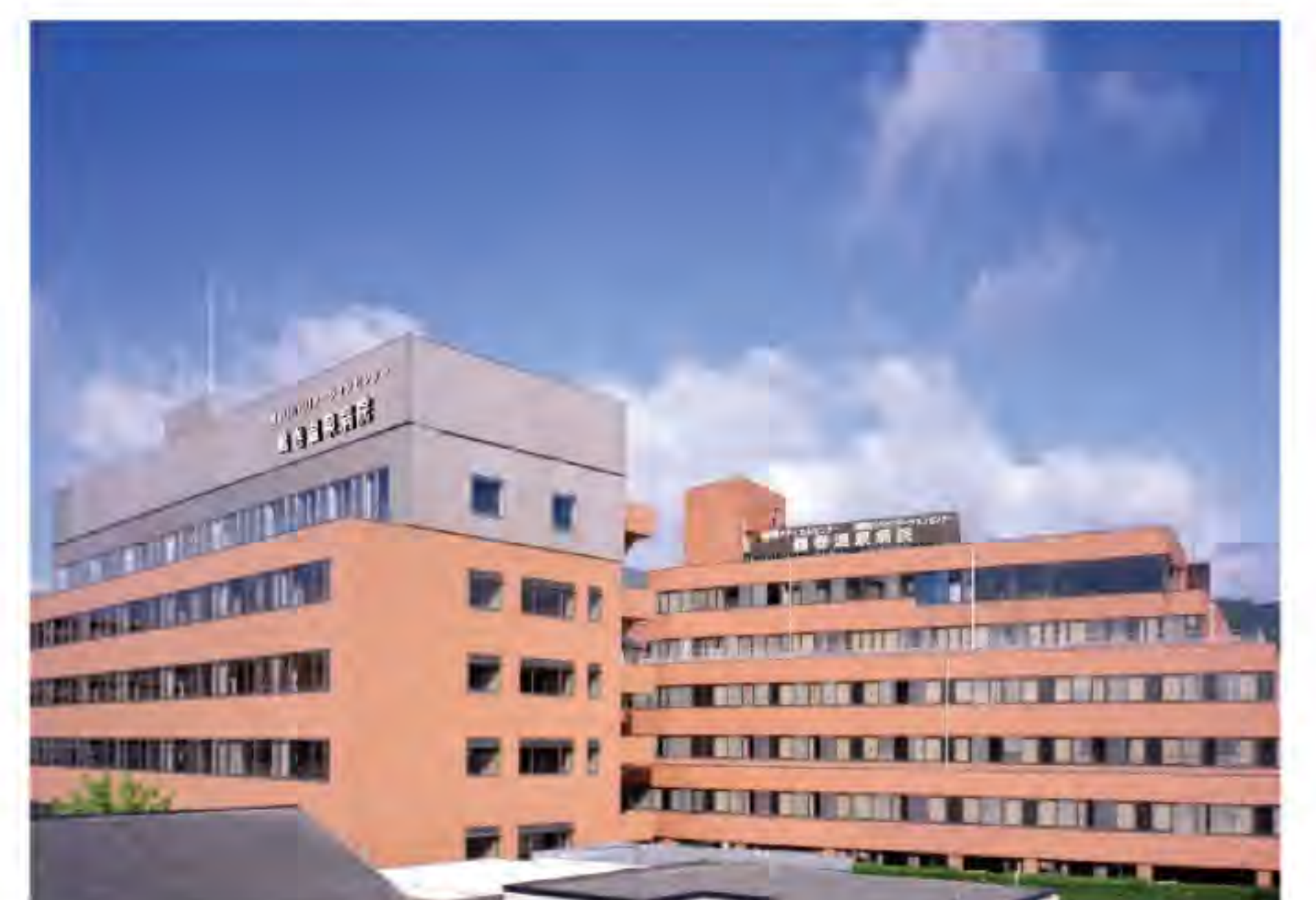
鶴巻温泉病院 全景