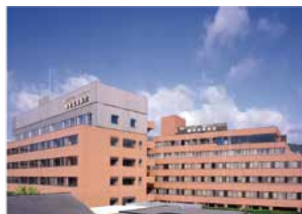
鶴巻温泉病院 全景