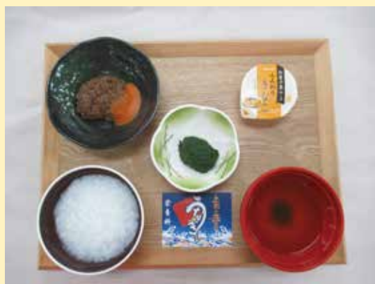
【献立】・ご飯 ・すまし汁 ・うなぎの蒲焼 ・青菜のお浸し ・和菓子（ひまわりの練切）